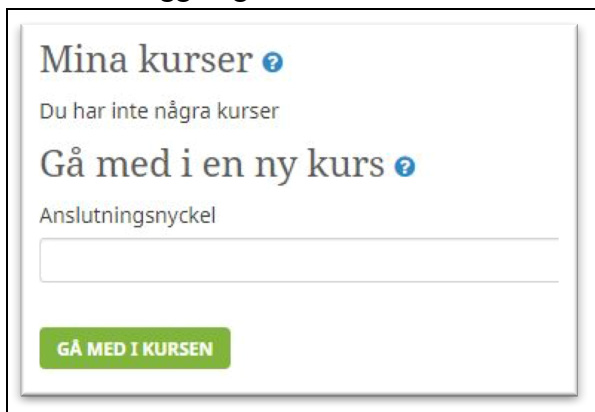
Bild 3. Instruktioner i Tabletkoulu